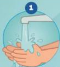
1 SE MOILLER LES MAINS