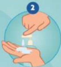
2 PRENDRE DU SAVON