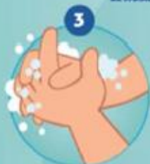
3 SE SAVONNER LES MAINS