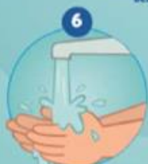
6 SE RINCER LES MAINS