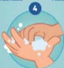
4 SE FROTTER LE DOIGT DES DOIGTS, LES DEUX FACES DES MAINS...