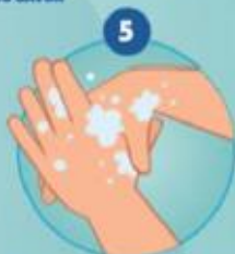
5 ...ET FRICTIONNER LE POUCE DE LA MAIN GAUCHE PAR ROTATION DE LA MAIN DROITE ET INVERSEMENT