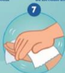
7 SE SÉCHER SOIGNEUSEMENT